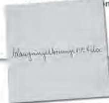
Abb. 1: Ankündigung

2.0 Bild Bildung blog Bundeskongress collaborative intelligence collective intelligence formerly cultural hacking Cyberspace digital natives Educational Gaming eLearning ePortfolio ePUSH Forschung Interface insertwingularity iPhone Jobs kiss Kunst Kunstpädagogik Lehre Lehrer life Medienkultur Mediologie microblogging miscellaneous networking Medium net, nature, politics, podcast Publication Schule SecondLife social networking Tagung ubiquity Universität user generated content user_art Visualisation web2.0 Weltweit-Werden Wissen in you